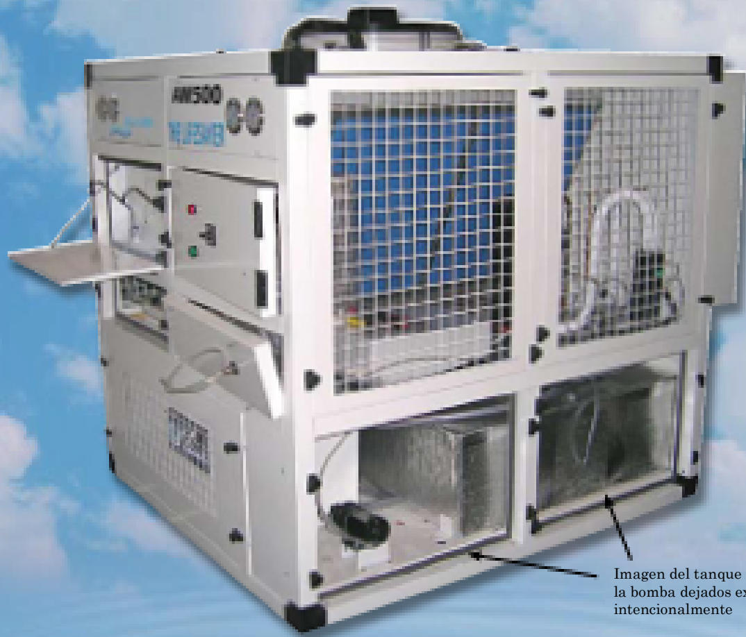
Imagen del tanque de agua y de la bomba dejados expuestos intencionalmente