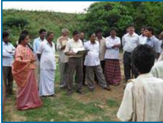
Oficiales del Gobierno explicando el proyecto a miembros de la comunidad