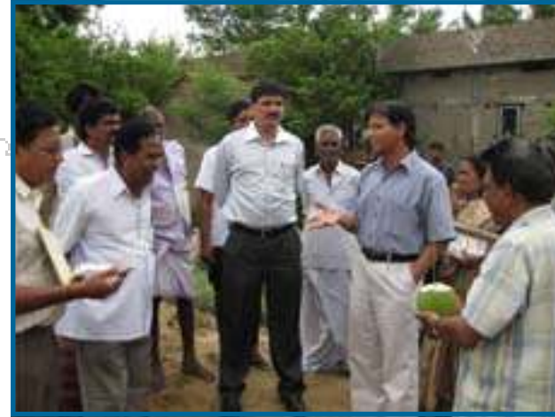
Oficiales del Gobierno impartiendo instrucciones a autoridades locales