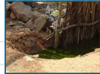
Pozo de agua sucia, fuente de agua de la comunidad

Air Water Corporation con su exclusiva tecnología se ha comprometido a poner fin a la miseria y la desesperación. El agua es la clave para la vida y la fácil disponibilidad de abundantes suministros de agua potable es fundamental para cambiar la vida de todos los habitantes en situaciones de escasez.