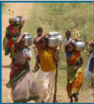
Jóvenes llevando agua a sus hogares

Muchos pueblos y ciudades no tienen suministro de agua y los habitantes se ven obligados a utilizar el agua sucia y contaminada de los pozos que consiguen, caminan durante horas para recoger el agua y llevarla a casa en jarros, ollas y otros utensilios pesados.