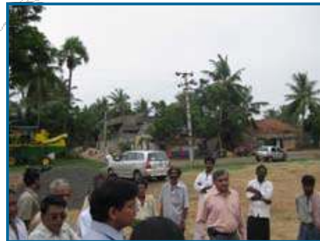
Autoridades locales otorgando lote de tierra para implantar solución