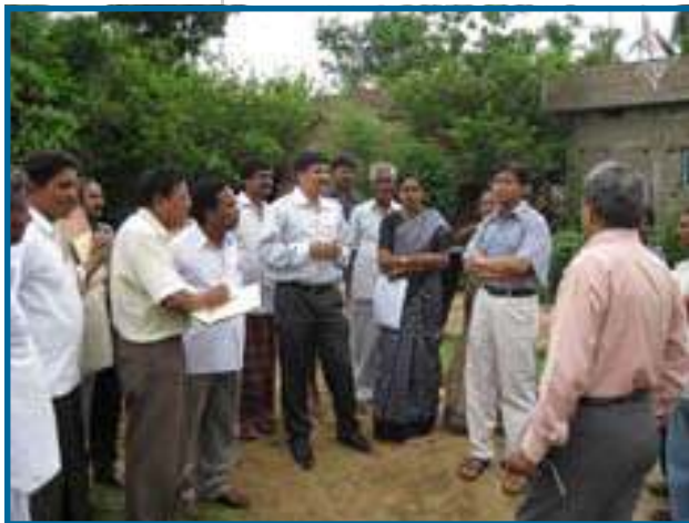
Miembros del Gobierno solicitando espacio de tierra a autoridades locales