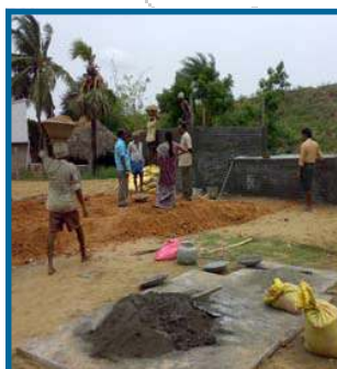
Construyendo la solución.

El programa Subsistencia Comunitaria consiste en la instalación de una máquina de generación agua del aire con capacidad de producción de 1000 litros agua por día (unidad AW1000) ubicada sobre una plataforma de concreto. La solución incluye, además, dos tanques de almacenamiento provistos con múltiples grifos que permiten el surtido permanente de miles de litros de agua potable a la gente de la comunidad. Esta solución ofrece a los habitantes de Jalimudi una fuente de agua limpia, pura y apta para el consumo a la cual pueden recurrir