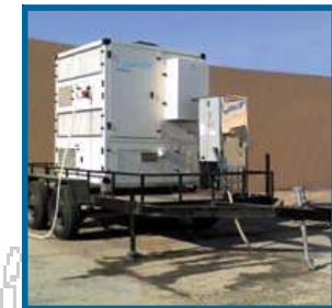
Estación de agua existente en Dubai, EAU