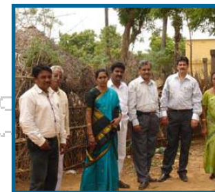
Miembros del Gobierno

Jalimudi es una comunidad de aproximadamente 600 personas obligadas al sufrimiento diario de caminar durante horas en búsqueda de fuentes de agua que les permita llevar a casa una poca cantidad de la misma, cuando la consiguen.